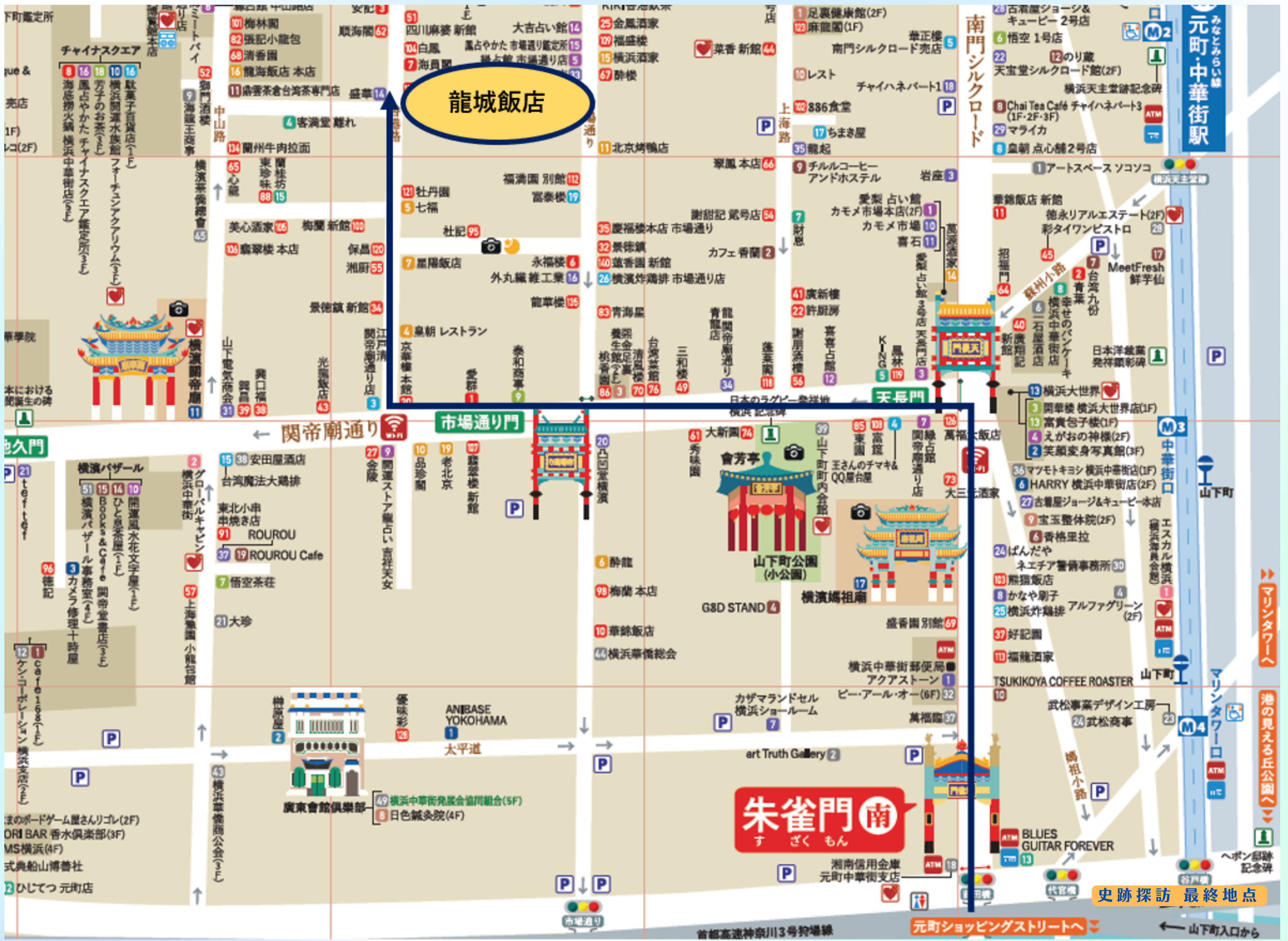
< 龍城飯店 拡大図 >